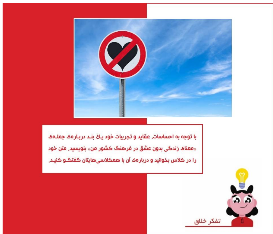
شکل ۷: توجه به احساسات و عقاید در آموزش

زبان‌آموزان با یکدیگر است، در این نوع از آموزش حائز اهمیت می‌باشد. این تمرین که با هدف تقویت توانایی‌های گفتاری و شنیداری و نیز ارتقای تفکرهای خلاق و آینده‌نگر در فراگیران طراحی شده است، با دور کردن فراگیران از انزوا و ترغیب ایشان به فعالیت گروهی، منجر به بهبود مدیریت درون‌فردی و میان‌فردی آنان نیز می‌شود. در چنین شرایطی زبان‌آموزان می‌توانند از طریق تماس تلفنی، پیام‌رسان واتساپ و غیره با یکدیگر در ارتباط باشند و متن مکالمه خود را تنظیم کنند. آن‌ها می‌توانند برای خلاقانه نمودن ارائه کلاسی خود روش‌های مختلفی به کار برند. به عنوان مثال استفاده از موسیقی ملایم هنگام مکالمه می‌تواند بر جذابیت کار ایشان بیفزاید. هر چند تصور بر این است که در چنین موقعیت‌هایی توجه تمامی زبان‌آموزان معطوف به کلاس باشد اما مدرس می‌تواند جهت اطمینان و نیز جلوگیری از منفعل شدن سایر افراد کلاس سؤال یا سؤالاتی تستی از دل مکالمه طرح کند و از سایر زبان‌آموزان بخواهد به آن پاسخ دهند.