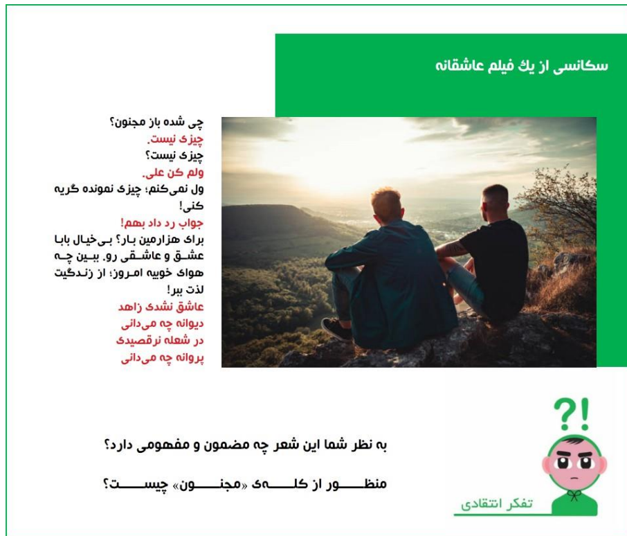
شکل ۳: سکانسی از یک فیلم عاشقانه

کلاسی در فضای الکترونیکی نشان دادن بازخوردی مناسب به آن‌ها است؛ به طور مثال گاه یک کلام مثبت یا محبت‌آمیز تأثیری بلندمدت بر انگیزه فراگیران خواهد داشت.