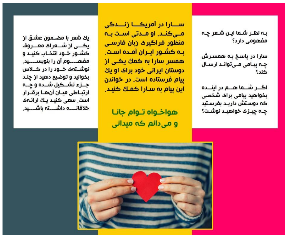
شکل ۹: تمرین انواع تفکر، حواس و هیجان

به نظر می‌رسد یکی از راه‌های تقویت مهارت‌های زبانی استفاده از روایت‌هاست که با استفاده از امکانات موجود در بسترهای آموزش مجازی به راحتی امکان‌پذیر است. واضح است روایت‌ها افزون بر اینکه می‌توانند گوشه‌ای از فرهنگ یک کشور را در خود جای دهند، ضمن درگیر نمودن حواس فراگیران، منجر به افزایش هیجانات مثبت در ایشان می‌شوند. به عنوان مثال روایت فوق در بر دارنده زیانگ‌های «پاره‌گفتارهایی از زبان که بخشی از فرهنگ در آن نهفته است» درباره خواستگاری ایرانی است که ضمن توجه به ارزش‌ها و فرهنگ، حواس و هیجانات فراگیران را نیز درگیر می‌کند. در این راستا به منظور معطوف نمودن توجه مخاطبان به کلاس مجازی و نیز تقویت مهارت‌های زبانی، استفاده از بازی‌های گروهی سودمند می‌نماید. بنابراین بازی گروهی فوق که با هدف تقویت مهارت خوانداری زبان آموزان طراحی شده است با درگیر نمودن هیجانات فراگیران، آنان را ترغیب به مشارکت کلاسی کرده، منجر به بهبود توانایی مدیریت درون‌فردی و میان‌فردی در ایشان می‌شوند و مدرس را در دست‌یابی به اهداف آموزش یاری می‌دهند.